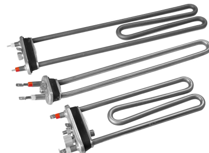
Resistencias para lavadora

Backer pone a su disposición una completa gama de recambio para línea blanca de las principales marcas.